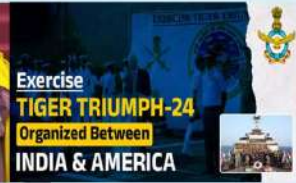
Exercise TIGER TRIUMPH-24 Organized Between INDIA & AMERICA