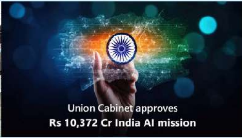
Union Cabinet approves Rs 10,372 Cr India AI mission