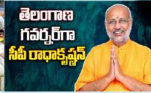
తెలంగాణ గవర్నర్ గా సీపీ రాధాకృష్ణన్